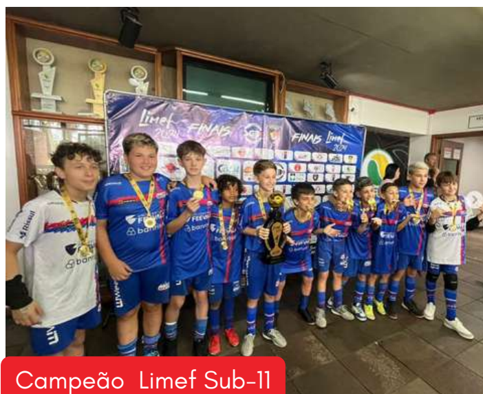
Campeão Limef Sub-11