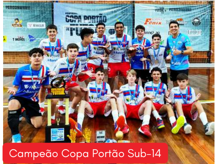
Campeão Copa Portão Sub-14