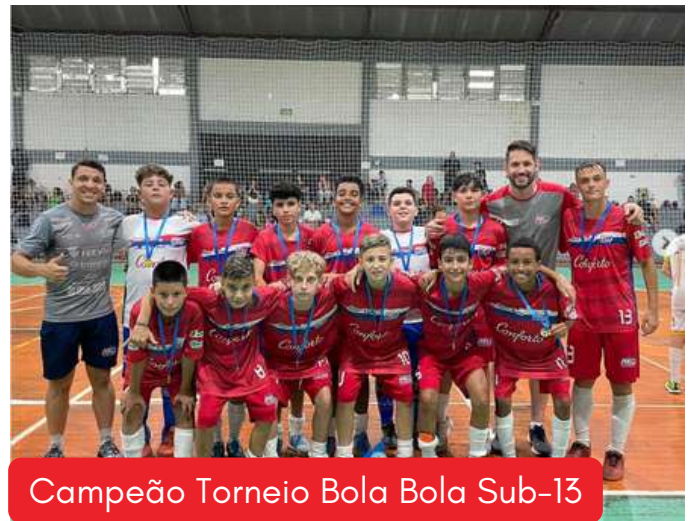
Campeão Torneio Bola Bola Sub-13