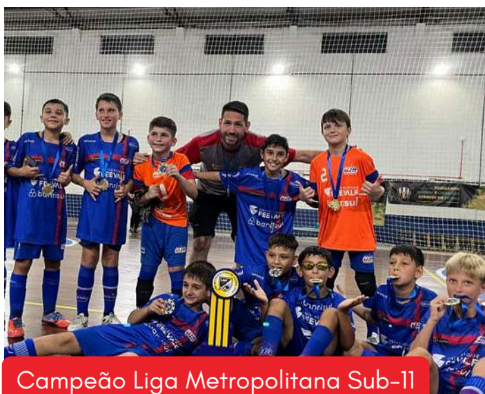
Campeão Liga Metropolitana Sub-11