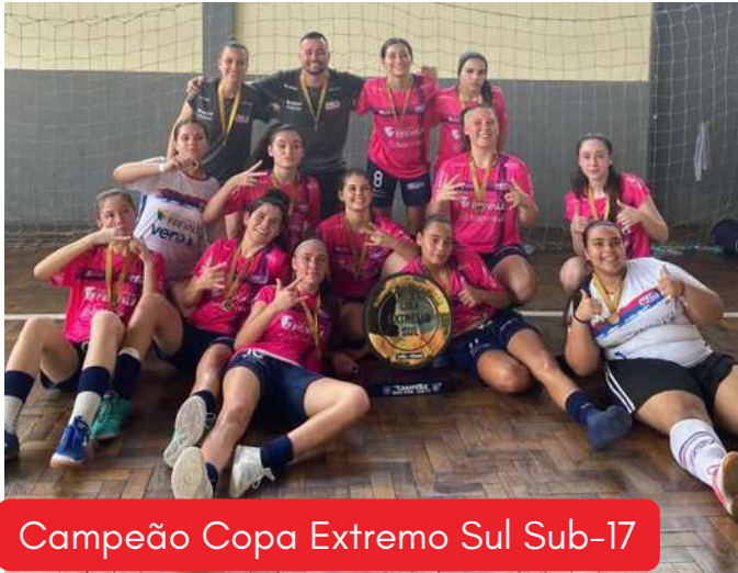
Campeão Copa Extremo Sul Sub-17