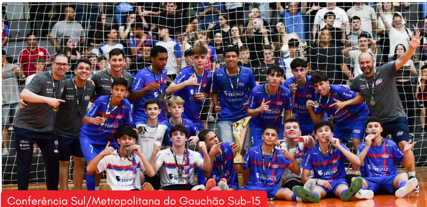
Conferência Sul/Metropolitana do Gauchão Sub-15