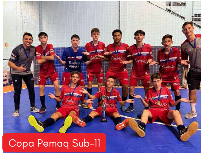
Copa Pemaq Sub-11