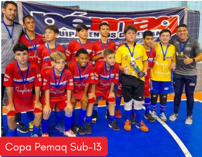
Copa Pemaq Sub-13