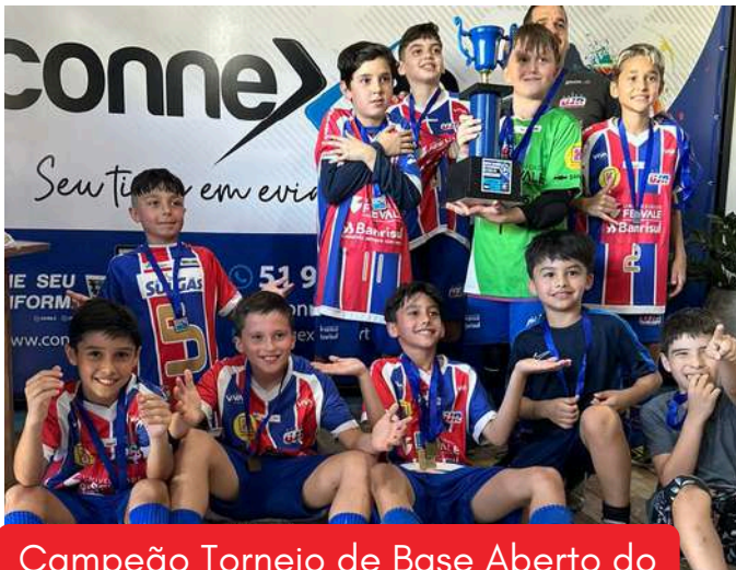
Campeão Torneio de Base Aberto do Soberano Sub-11